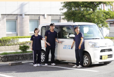
デイサービス送迎