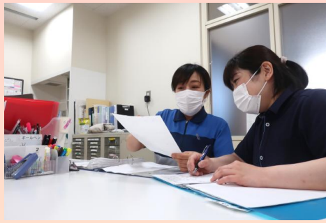
ケアプランの相談