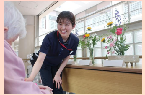
利用者とのコミュニケーション