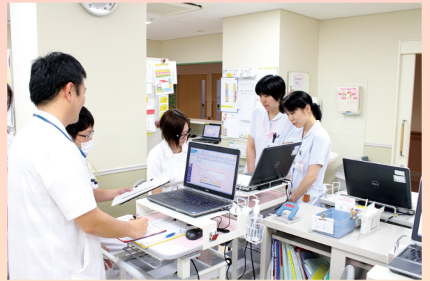
看護師とのミーティング