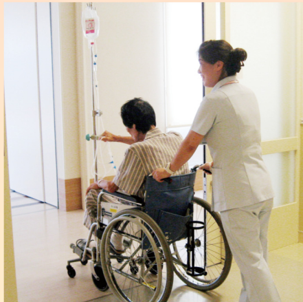
車椅子で患者さんを送迎