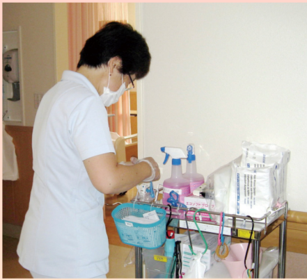
病室の清掃（環境整備）