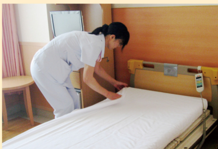
ベッドメイキング